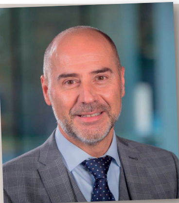
Voorzitter Ontbijtclub 2024 – 2025